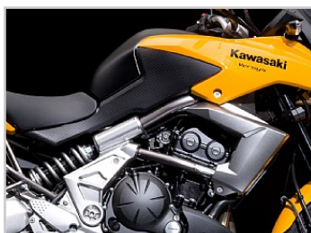
Smalle, rechte rijpositie