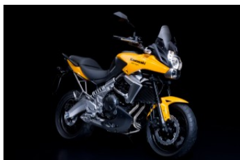
Pearl Solar Yellow / Metallic Flat Spark Black