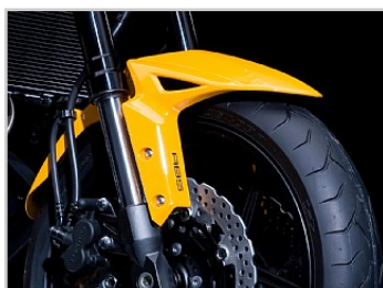
Actieve controle bij elke situatie