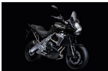
Metallic Spark Black / Metallic Flat Spark Black