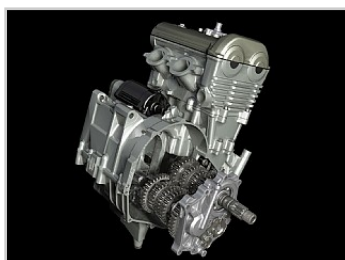
Geweldige 649cc Parellel Twin