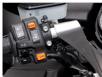
2de generatie K-ACT