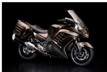
Metallic Magnesium Gray / Flat Super Black