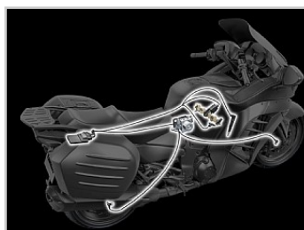
Kawasaki Traction Control (KTRC)