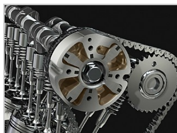
1,352cc vier cilinders in lijn motor met variabele