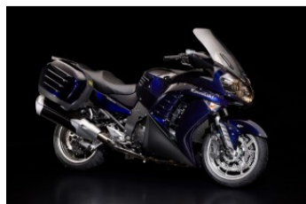
Candy Neptune Blue / Flat Super Black